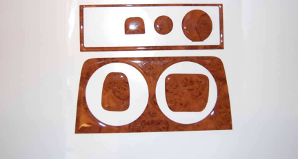
Materiales que sobran (cabina sin aire, sin espejos electricos, etc)