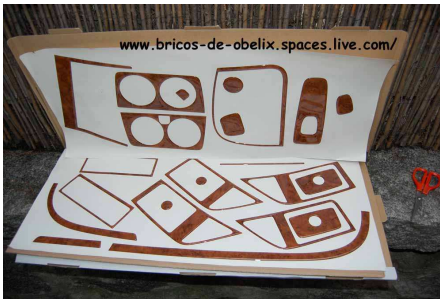
Materiales que vienen en el paquete

La verdad es que queda como menos "fragoneta" y le da un aire agradable al salpicadero.