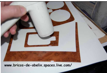
Calentar la pieza a instalar por ambas caras (cuidado con las piezas finas, que se queda blandengue, como "chicle")