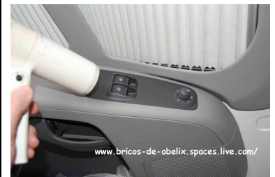
Calentar con secador después de limpiar con alcohol