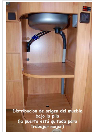
Mueble bajo el fregadero antes. Está quitada la puerta

Distribución de origen del mueble bajo la pila (la puerta está quitada para trabajar mejor)