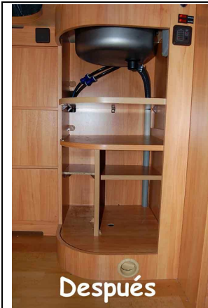
Mueble del fregadero después

Distribución de origen del mueble bajo la pila (la puerta está quitada para trabajar mejor)