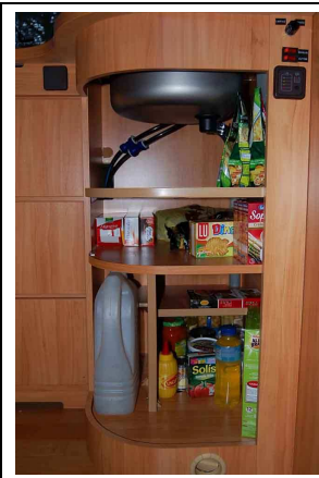
Ahora se aprovecha mejor el sitio. Sólo falta poner la puerta