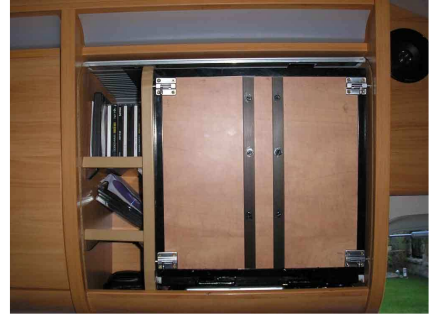
Y pongo unos refuerzos de aluminio en donde irá atornillado el brazo articulado