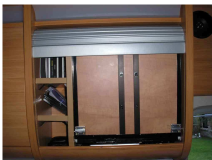
Hay que tomar bien medidas para que se pueda cerrar la persiana original