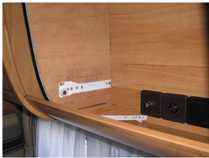
Coloco unas guías correderas para la base