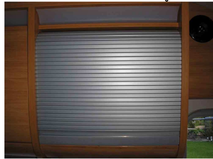
De forma que todo el conjunto vaya dentro del mueble en viaje