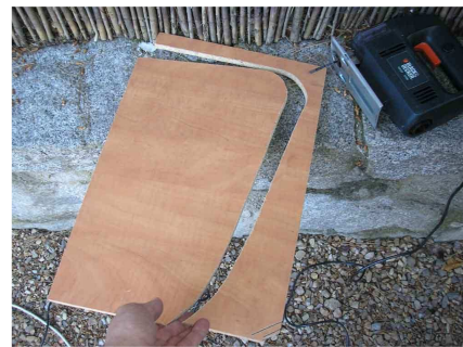
Se toman medidas y se corta un tablero