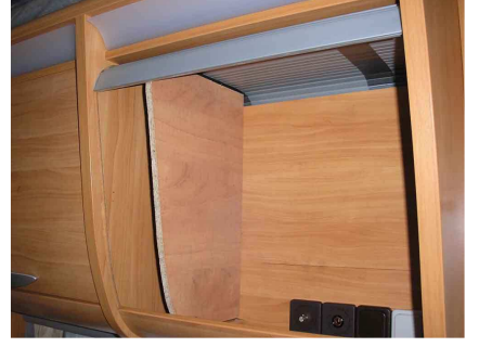
Instalado para acotar el hueco necesario