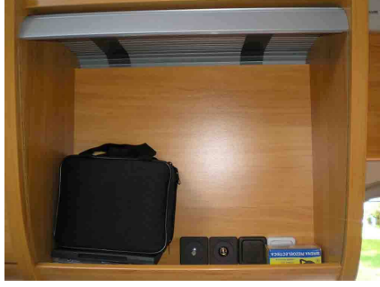
Hueco original antes de empezar

Por último, para sujetar la "tapa-soporte", le puse 4 cerrojos correderas alojados en la pared del hueco del TV