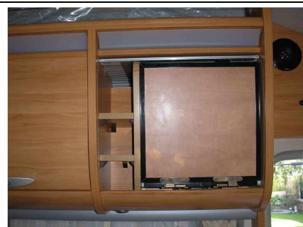
La pongo y la articulo abajo con bisagras resistentes para soportar el peso del TV