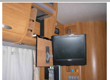
Ahora se puede ver a una altura más cómoda. Se puede extender en horizontal hacia el centro del salón