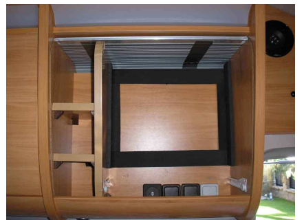
Goma-espuma para acolchar el hueco y que no se golpee el TV en la marcha